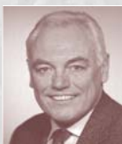
Walter Schneeloch Vizepräsident des DOSB, Präsident des Landessportbundes NRW, Vorsitzender des Trägervereins der Führungs-Akademie des DOSB

Wir freuen uns, wenn Sie in diesem Programm Interessantes für sich persönlich wie für Ihren Verband oder Verein finden können.