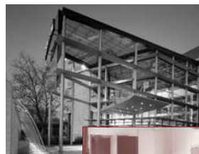
Radisson SAS Hotel, Köln