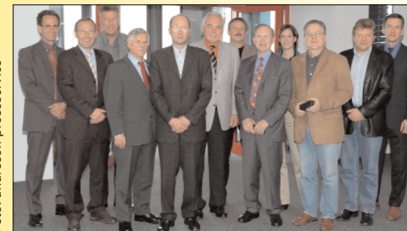
Noch enger zusammenrücken: Die Vertreter der Netzwerkpartner während einer Tagung in Köln